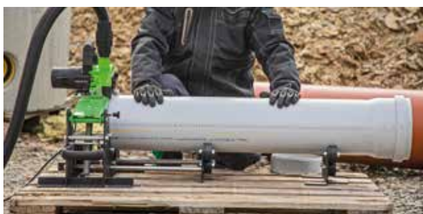
Ustaw rurę dokładnie w pionie i poziomie do tarczy tnącej