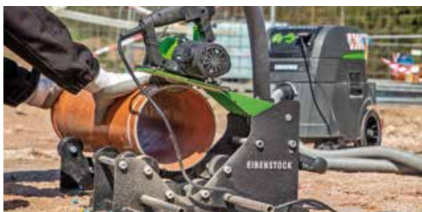
Cięcie i fazowanie w jednym kroku